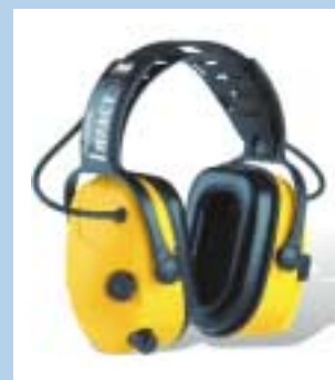
3 Elektroniske høreværn. De er forsynet med mikrofoner udvendigt og højtalere indvendigt. Hvis lydniveauet bliver højt begrænses lyden elektronisk på indersiden af høreværnet. De sikrer, at man kan snakke tydeligt sammen, når der ikke er støj, og samtidig sikrer de mod høreskade. De kan anbefales til personer med hørehandicap.