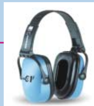
1 Normalt standard høreværn.

Ørekopper slides, bøjlen kan blive slap og tætningsringen kan ødelægges. Høreværn skal være velholdte og de skal altid bæres, når støjen er der.