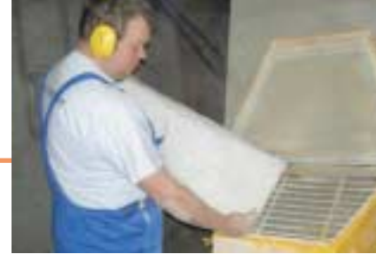
Tømning af sækkevarer i mølleri