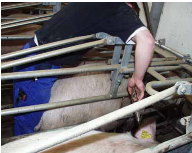
Vaccination af søer i bokse indebærer risiko for klemning af arm og hånd