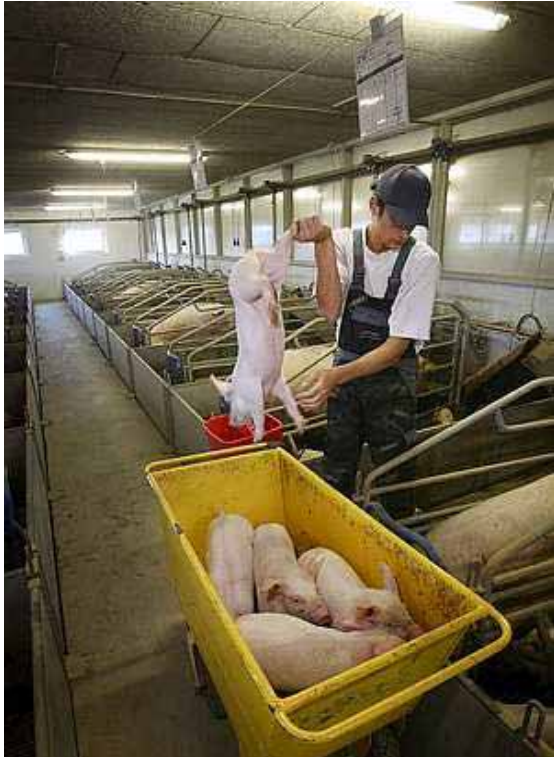
Farestier kunne blive mere hensigtsmæssige at arbejde i

Deltagerne i temadagen lagde vægt på, at der findes eksempler på gode indretninger af farestalde, herunder især de sidevendte farestier, som medarbejderne oplever som mere hensigtsmæssige at arbejde i sammenlignet med de traditionelle farestier.