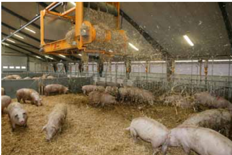
Automatisk tildeling af strøelse kan minimere risikoen for skader

Man fremførte særligt to problemstillinger med søer i løsdrift set i forhold til inventar, teknisk udstyr og staldindretning. Manuel tildeling af strøelse kan være behæftet med en risiko for skader da "søer i løsdrift er ofte meget ivrige for at få halm først".