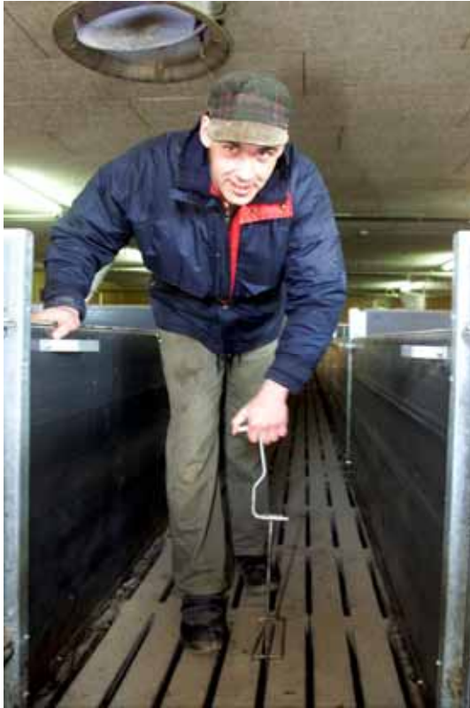
Udslusning af gylle indebærer risiko for alvorlige ulykker med svovlbrinte

Når der skal udføres egentlige reparationer på udstyr i gyllekanaler, pumpebrønde og lagertanke, bør arbejdet udføres af professionelle firmaer, der anvender det fornødne sikkerhedsudstyr til den type opgaver. Arbejdstilsynets AT-anvisning nr. 2.6.1.1. August 1996 beskriver sikkerhedsproceduren.