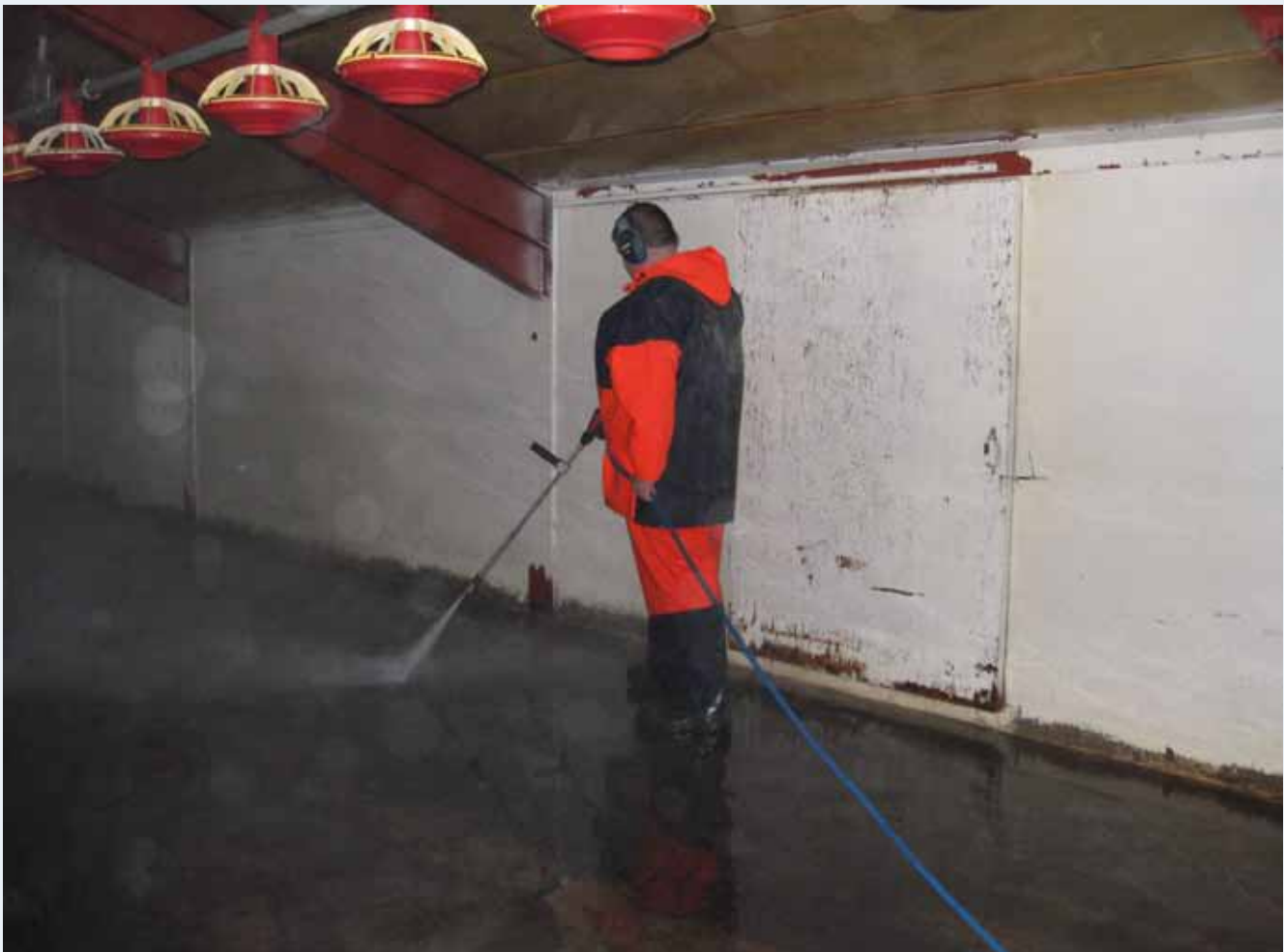
Spații de curățare pentru puii de carne

Angajatul trebuie să folosească toate echipamentele de protecție necesare și pe toată durata lucrului. Dacă echipamentul este defect, angajatul trebuie să-și anunțe angajatorul.