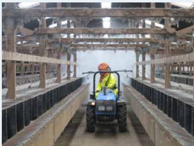
Podeaua unei ferme de nurci poate fi dezinfectată cu var hidratat.