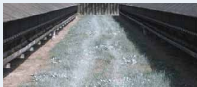
Solul este dezinfectat cu var după curățare

Fermele care au fost afectate de plasmacitoză sunt puse sub supraveghere publică. Aceasta include curățarea și dezinfecția. Ferma trebuie să fie dezinfectată de două cu cel puțin o săptămână între. Curățarea și dezinfecția trebuie aprobate de autoritățile locale în domeniul veterinar și alimentar. Dezinfectantul și temperatura de afară trebuie „documentate” – ziua în care a fost făcută, de către cine, numele persoanelor care au dus lucrul la bun sfârșit.