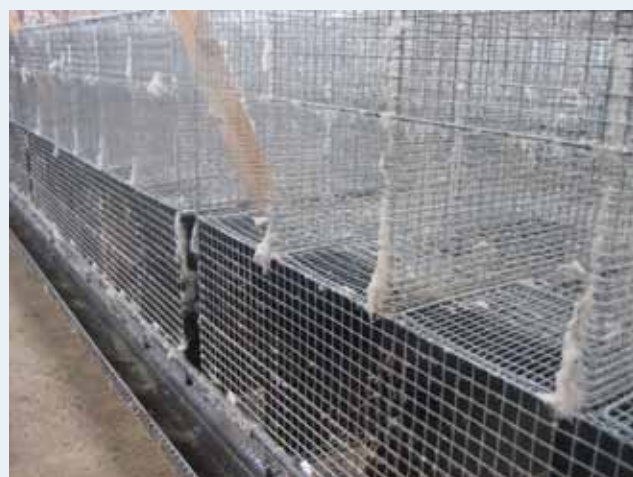
Pelsrester på minkbure fjernes nemmest med en turboduse.

Til sidst vaskes loft og træværk, og gyllerender skylles rene for løst og vådt snavs.